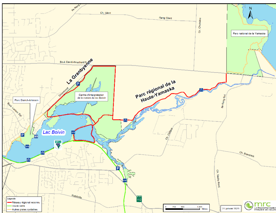
La Granbyenne et le Parc régional de la Haute-Yamaska

Cette reconnaissance permet à la MRC ainsi qu'à la Corporation d'aménagement récréotouristique de la Haute-Yamaska (CARTHY) d'alléger la charge financière associée à l'entretien du réseau cyclable, puisque 21,34 kilomètres supplémentaires sont désormais admissibles à une aide financière, ce qui représente une somme additionnelle de 35 035 $ par année.